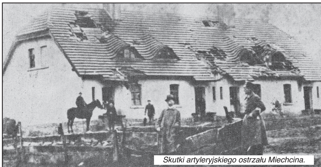
Skutki artyleryjskiego ostrzału Miehcina.

S. Jankowiak, P. Bauer, Ziemia gostyńska w Powstaniu Wielkopolskim 1918 - 1919. Gostyń 1989. s. 76