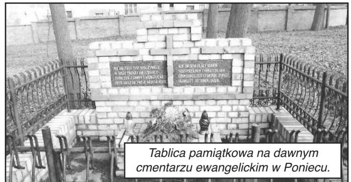
Tablica pamiątkowa na dawnym cmentarzu ewangelickim w Poniecu.