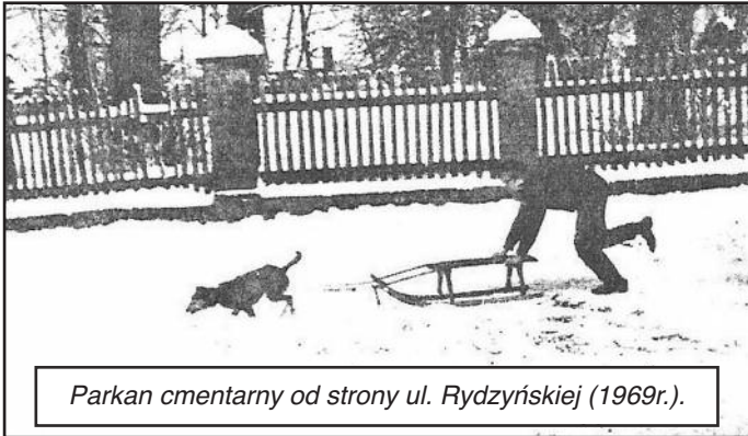
Parkan cmentarny od strony ul. Rydzyskiej (1969r.).

Ludność niemiecka wyznania ewangelickiego stanowiła w przeszłości znaczącą liczbę populacji Ponieca i okolic. Śladem po istnieniu tego wyznania jest nie tylko kościół pw. Chrystusa Króla, ale również dawne cmentarze w Poniecu i okolicy. Nadchodzące dni Wszystkich Świętych i Zaduszek stwarzają okazję, aby przypomnieć sobie o tych miejscach i zapalić również znicze dla uczczenia pamięci ludzi, których nazwiska w większości uległy zapomnieniu.