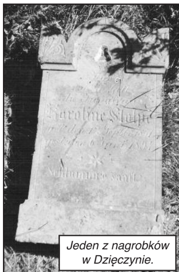
Jeden z nagrobków w Dzięczyźnie.

W okolicach Ponieca silne społeczności niemieckie zamieszkiwały