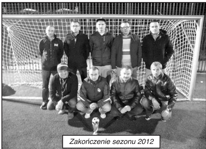
Zakończenie sezonu 2012