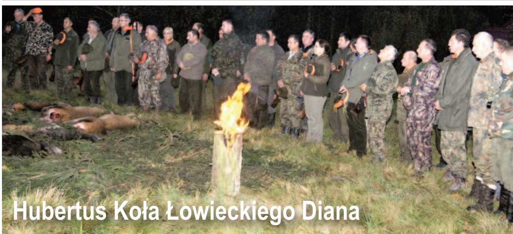
Hubertus Koła Łowieckiego Diana