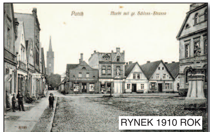
RYNEK 1910 ROK