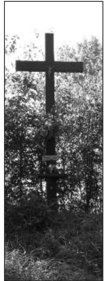
bitwy zostało zaznaczone na mapie wycieczek rowerowych, którą ustawiono w 2011 r. przy Gminnym Centrum Kultury, Sportu, Turystyki i Rekreacji w Ponieciu.

Tematyka bitwy jest realizowana na lekcjach historii w Szkole Podstawowej i Gimnazjum w Ponieciu. Powstało kilka prac uczniowskich na temat bitwy, np. obraz, makiet (niestety już nie istnieje) oraz mapa. Teren bitwy odwiedzają uczniowie z kółka historycznego. Miejsce