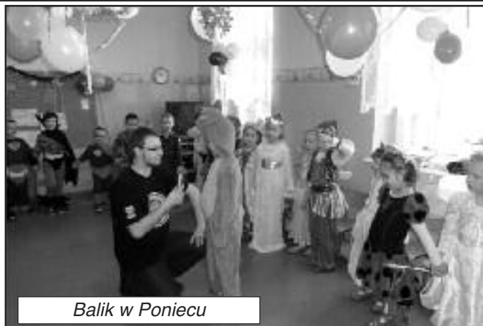
Balik w Poniecu

Swoją bal karnawałowy miały 26 stycznia przedszkolaki z Ponieca. Dzieci z wielką ochotą wzięły udział w zabawie i konkursach tanecznych. Najmłodszy chętnie prezentowali swoje kolorowe stroje. Balik odbył się w radosnej atmosferze.