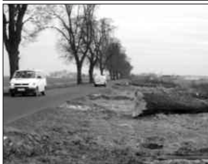
Jedną z najważniejszych inwestycji w gminie dotyczy przebudowy drogi powiatowej na odcinku od Kłody do Ponieca. Już na początku lutego po jednej stronie drogi w pobliżu Kłody wycięte zostały wszystkie drzewa. Roboty przesuwają się będą w stronę gminy Poniec. Przypomnijmy, że dzięki staraniom urzędników powiatu znaczną część kosztów inwestycji pokryją środki europejskie.