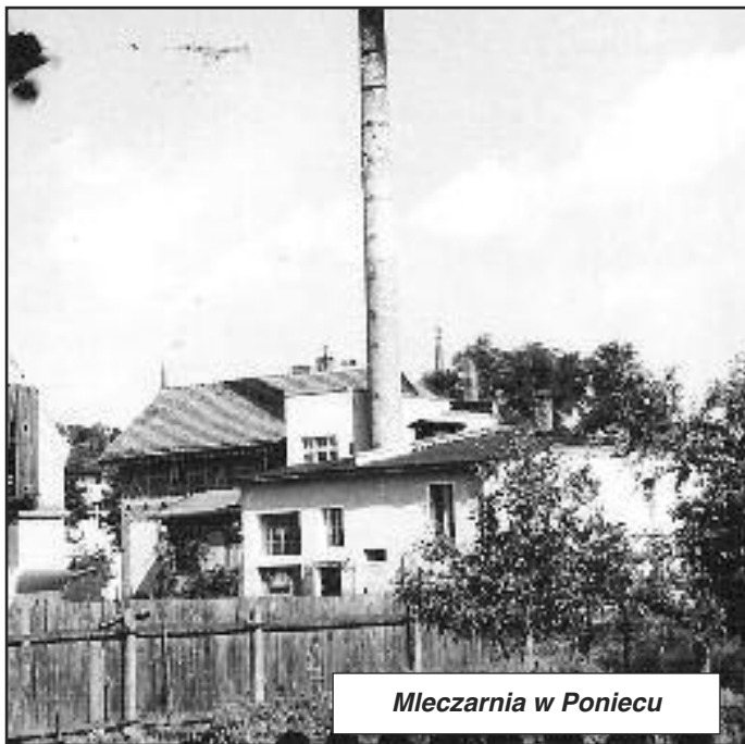
Mleczarnia w Poniecu

W okresie II wojny światowej stan gospodarki Ponieca i okolic uległ poważnemu pogorszeniu, głównie wskutek rabunkowej polityki okupanta hitlerowskiego. Również po wyzwoleniu spod okupacji niemieckiej, w styczniu 1945 r., trwały rekwizycje mienia dokonywane przez Armię Czerwoną. W pierwszym półroczu 1945 r. zabrano mieszkańcom gminy Poniec kilkaset zwierząt hodowlanych, kilkaset ton zboża, wozy.