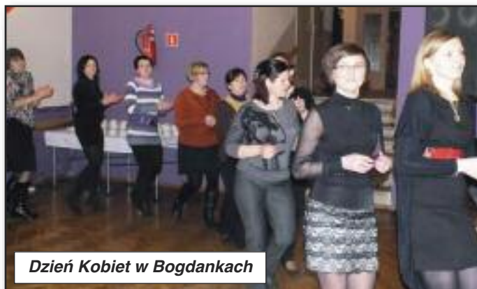
Dzień Kobiet w Bogdankach

Już 20 lutego panie z Bogdanek, Łęki Wielkiej i okolic postanowiły świętować Dzień Kobiet. Impreza była przednia, a szaleristwa na parkiecie trwały przez wiele godzin. Panowie przybyli na uroczystość obdarowali panie słodkościami i bukietem kwiatów. Po niezwykle udanej imprezie pozostały wspomnienia i pomysły na kolejny Dzień Kobiet za rok.