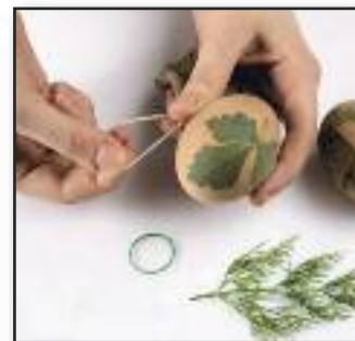
W roślinne wzory

Z nici można zrobić na szydełku delikatną „koszulkę na jajko”. Potem przyozdobić je trzeba sztykawkowymi listeczkami. Kompozycja będzie bardzo ładna.