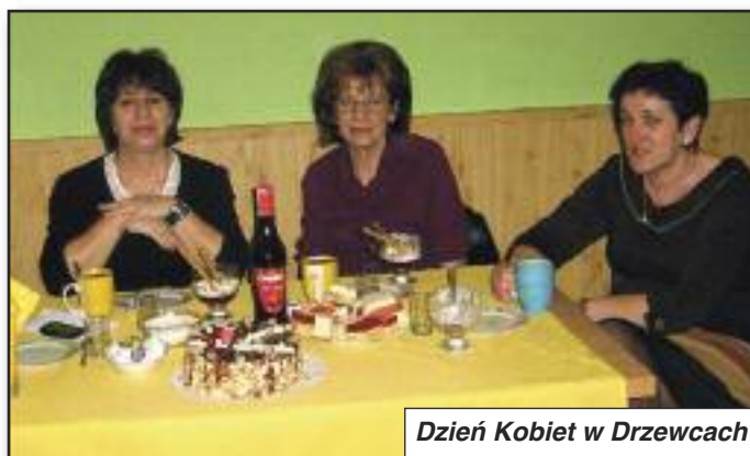
Dzień Kobiet w Drzewcach

Koło Gospożni Wiejskich Malwinki w Drzewcach 10 marca świętowało Dzień Kobiet. Ponad 30 par zebrano się na wspólnym słodkim poczęstunku. Pano wała miła atmosfera, w której snuto plany na temat tegorocznej działalności koła. Każda z par otrzymała pięknego kwiatka.