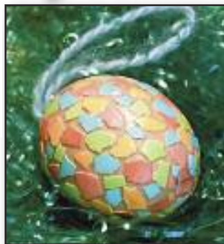
Mozaika na jajkach

Ugotowane jajka ufarbować trzeba na różne kolory. Część z nich należy obrać ze skorupki i pokruszyć je. Na koniec małe kawałeczki przykleić do jajek w kontrastowych kolorach.