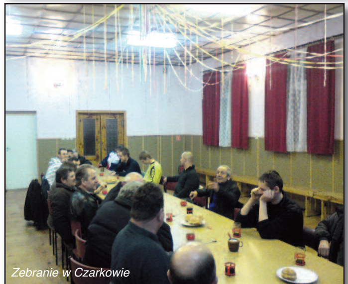
Zebranie w Czarkowie