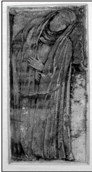
Niezidentyfikowana postać kościelna