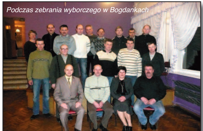
Podczas zebrania wyborczego w Bogdankach

Na zdjęciach zebrania wyborcze w Czarkowie i Bogdankach.