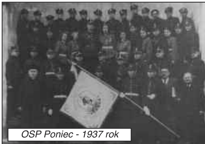
OSP Poniec - 1937 rok