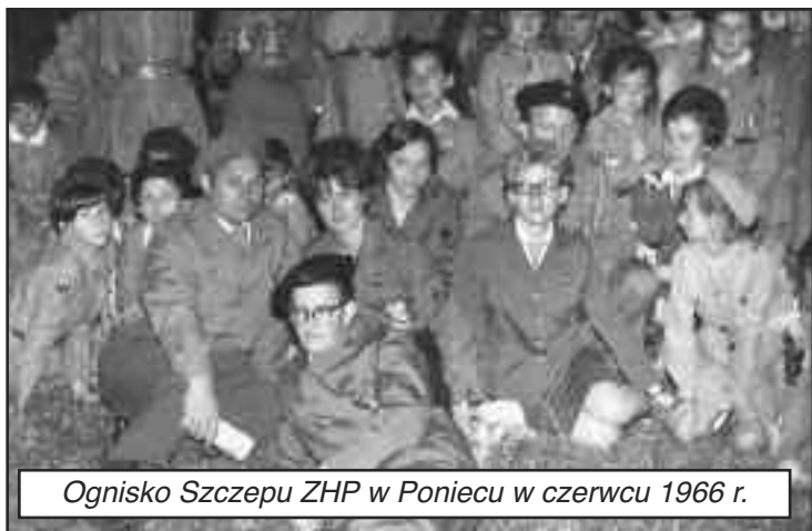
Ognisko Szczepu ZHP w Poniecu w czerwcu 1966 r.