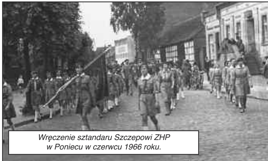
Wręczenie sztandaru Szczepowi ZHP w Poniecu w czerwcu 1966 roku.

Złe czasy nastały dopiero w latach 90. Zanotowano wówczas poważny spadek liczebności, gdyż część drużyn zaprzestała działalności. Szczególny kryzys organizacyjny nastąpił w Poniecu, gdzie przez pewien czas systematyczną pracę prowadziła