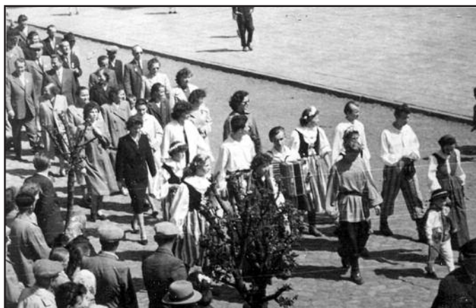
Zamieszczone zdjęcia pochodzą z obchodów 850-lecia Ponieca.

W świetle przytoczonych faktów data 1110 jako początek miasta nie znajduje w materiale źródłowym potwierdzenia. Wydaje się, że Poniec posiada jeszcze starszą metrykę. “